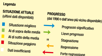
Tabella completa: www.socialwatch.org/statistics2008